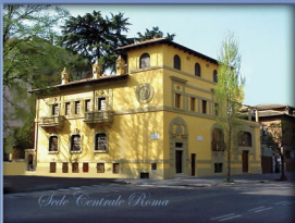
Sede Centrale Roma